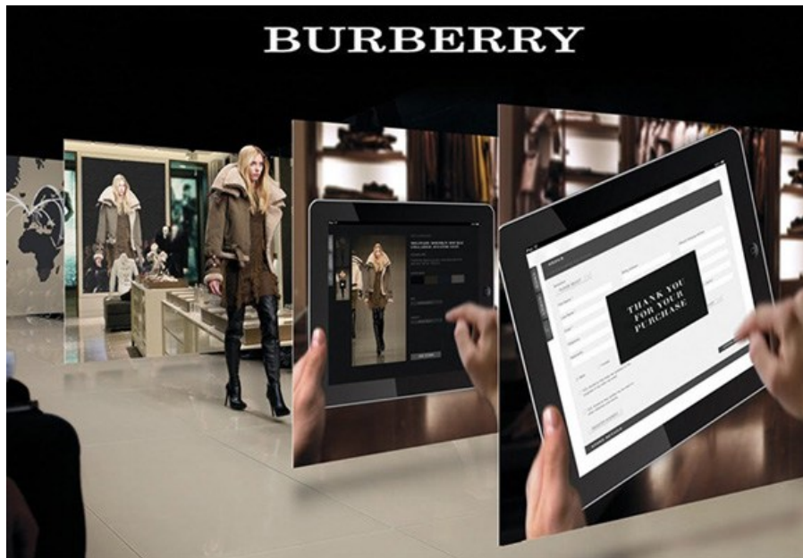
Firmas como Burberry ya aprovechan el cambio digital en el retail de lujo

La tecnología ha llegado para quedarse en el sector del lujo y según muchos expertos , es una de las válvulas de escape que ha tenido el sector para sortear con éxito la crisis y que las marcas afiancen su actividad. Firmas con Burberry por ejemplo , apuestan por la tecnología para crear experiencias únicas que añadan valor y exclusividad a sus productos.