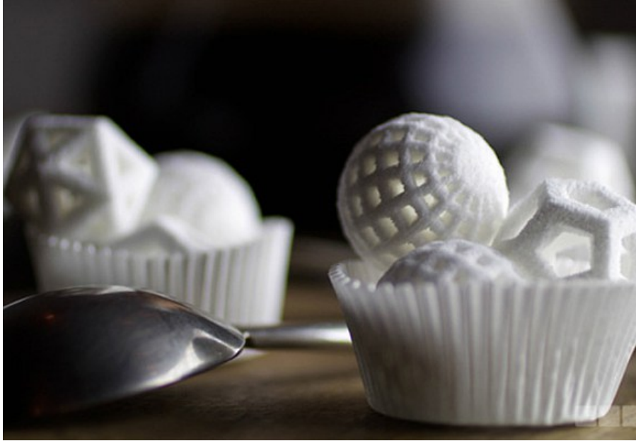
Lujo en 3D que se come. Haz clic para ampliar información

tecnología va a llevar al lujo por nuevos derroteros, porque son muchos los proveedores tecnológicos que se están acercando al lujo para proponer nuevos desafíos que añaden innovación y valor a sus productos. No hay que olvidar que las impresoras 3D por ejemplo están entrando en sectores hasta ahora inéditos como el gastronómico o que existen materiales inteligentes que procuran una nueva dimensión de bienestar.