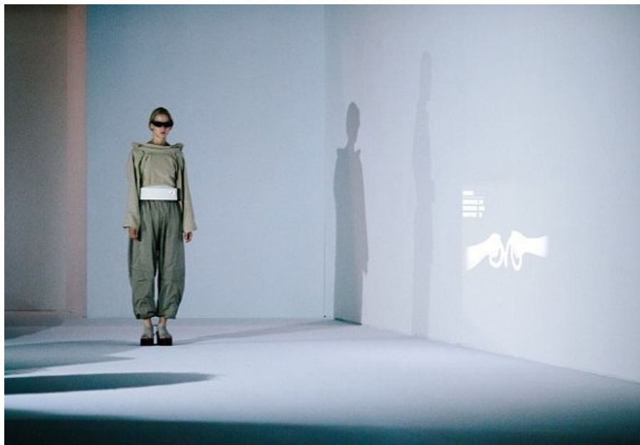
Desfile de Chalayan Primavera-Verano 2017. Haz clic para ampliar información

El lujo y las nuevas tecnologías no solo estarán cada vez más cerca, sino que van a suponer una revolución , tanto en la creación de nuevos productos o servicios de lujo, como en las estrategias y el marketing de los mismos. No se trata solo de usar efectos especiales con led y cristales... o emociones que se proyectan en la pared desde un cinturón, como en el caso de la marca de moda Hussein Chalayan .