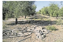
La Guardia Civil investiga el robo de unos 11.000 kilos de aceituna