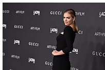
Kate Upton explota contra la liga de béisbol por no elegir a su novio (Mundo Deportivo - El Otro Mundo)