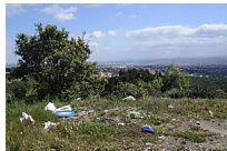
Los bomberos rescatan a un motorista de un barranco