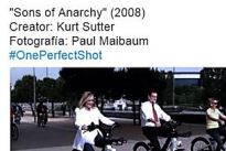
"Sons of Anarchy" (2008) Creator: Kurt Sutter Fotografía: Paul Maibaum #OnePerfectShot Te vas a reír con #OnePerfectShot, el hashtag que lo peta en... (Mundo Deportivo - El Otro Mundo)