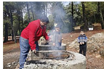
Un San Rafael sin candelas y barbacoas