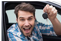
Por qué tus padres deberían comprarte un coche nuevo (Huffington Post para Polo)