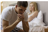
Cómo afrontar la eyaculación retardada en pareja (DMedicina)