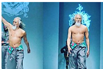
Este hombre tiene 80 años, desfila de modelo y atesora un mensaje inspirador