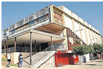
Urbanismo estudia la adquisición del edificio del antiguo cine Almirante...