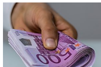
Ganar dinero desde tu casa, ahora es posible (La Noticia Perfecta)