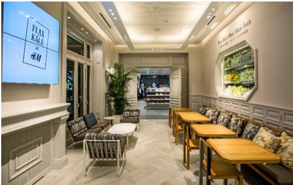
El viernes abrió en Barcelona la 'flagship' de H&M en el edificio Generali de Paseo de Gracia. Es la única del grupo sueco en incorporar un espacio gastronómico.