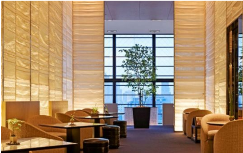
Chanel cuenta en el piso principal de su edificio de Ginza, en Tokio, con el restaurante Beige del reconocido chef francés, Alan Ducasse.

de una marca y se identifique con ella. No se trata de crear clientes fieles a una enseña, sino a un modelo de pensar, a una filosofía. Apple es el referente, consiguiendo apóstoles de su marca", asegura.